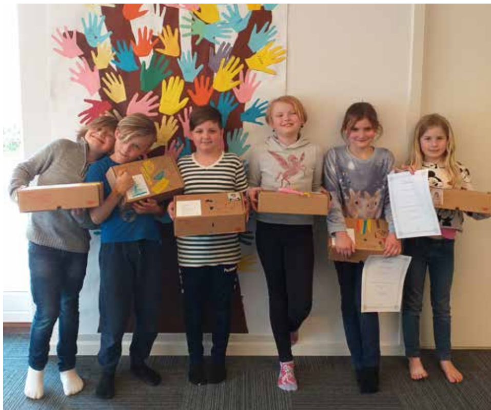
Fællesfoto af alle minikonfirmanderne 2019